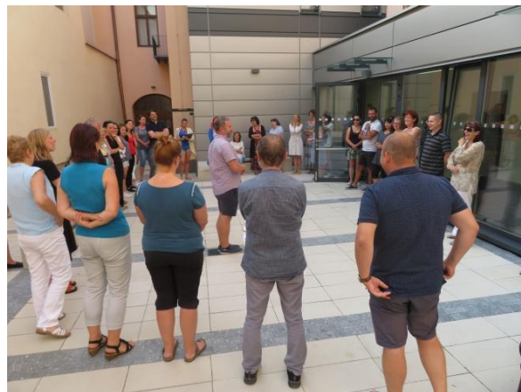
Školení pedagogického sboru 27.8.2020 na téma INKLUZE.